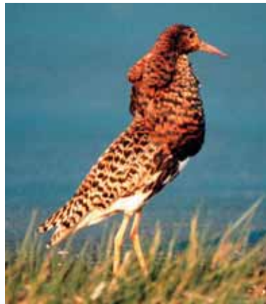
...kirjan kuvaa vastaava suokukkokoira.

suussa 7:n rantasirriäisen seurassa merisirriäisen, joka edelleenkin saman kuun 25, 26, 27, 28, ja 29 p:nä oleili Karjusuolla rantasirriäisten parissa". Aatinen kuvaa merisirriä näin: "Linnulla oli keltaisenvihreät nilkat (huomattavasti matalammat kuin rantasirriäisten), nokka melkein musta ja silmien yli valkea juova, jotapaitsi siivillä lennossa selvästi näkyvä, valkea juova. Sen selän väri oli kauliin tummanharmaa, joka höyhenen reunassa valkea puoli rengas, mikä teki linnun puvun ihmeen hienoksi; siivenkärjet mustat. Ruokailutapansa puolesta erotin sen jo kauaksi rantasirriäisistä.