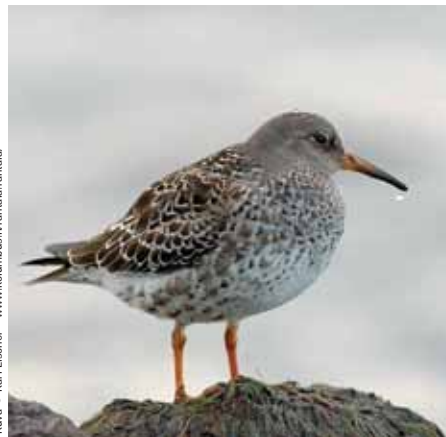
Aatisen havaitsema merisirri oli ilmeisesti nuori isosirri. Tämä on kuitenkin aito merisirri.

suussa 7:n rantasirriäisen seurassa merisirriäisen, joka edelleenkin saman kuun 25, 26, 27, 28, ja 29 p:nä oleili Karjusuolla rantasirriäisten parissa". Aatinen kuvaa merisirriä näin: "Linnulla oli keltaisenvihreät nilkat (huomattavasti matalammat kuin rantasirriäisten), nokka melkein musta ja silmien yli valkea juova, jotapaitsi siivillä lennossa selvästi näkyvä, valkea juova. Sen selän väri oli kauliin tummanharmaa, joka höyhenen reunassa valkea puoli rengas, mikä teki linnun puvun ihmeen hienoksi; siivenkärjet mustat. Ruokailutapansa puolesta erotin sen jo kauaksi rantasirriäisistä.