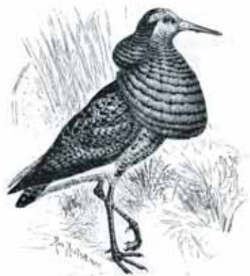
Suokukkokoiraalla on vain keväällä huomiota herättävä kaularöyhelö. Kuva Suomen Luurankoiset -kirjassa ja...

Erityisasemassa olivat kahlaajat. Tästä Aatinen intoutuu hehkuttamaan: "Tämä paikka oli elokuussa (myös heinäkuun lopulla) ja syyskuun alussa oikea kahlaajien eldorado! Karjusuolla viihtyivät linnut erittäinkin paikassa, jossa oli leveästi pahalta haisevaa suklaanruskeata vettä ja mustanruskeata mutaa". Aatisen havainnot hämmästyttävät ketä hyvänsä tämän päivänkin lintuharrastajaa. Suosirrejä oli varsin vähän, enimmillään 30.9. 1925 8 yksilöä, pikkusirrejä muutamia yksilöitä (Pirkanmaan ensimmäiset), lapinsirrejä (silloin nimeltään